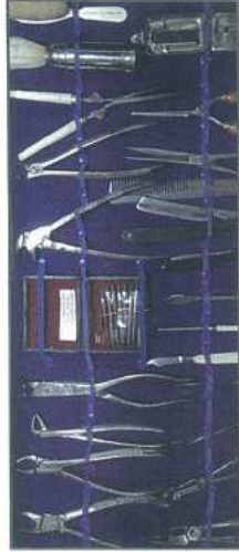
Peças do barbeiro, dentista e sangrador