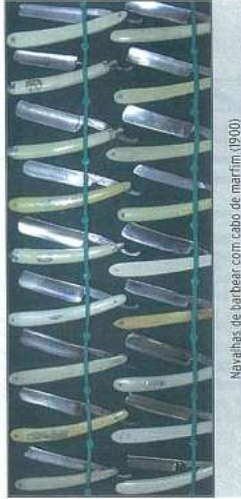
Navalhas de barbear com cabo de marfim (1900)