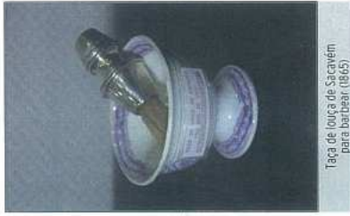
Taça de louça de S. Cravém para barbeiro (1885)