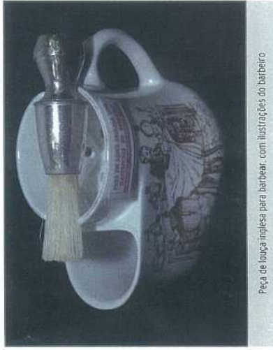
Peça de louça inglesa para barbeiro, com ilustrações do barbeiro