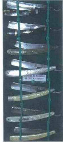
Navalhas de barbear, com destaque para a navalha do rei D. Carlos (ao centro)