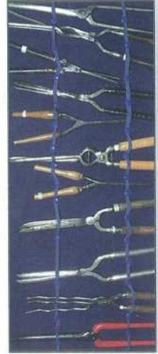
Ferros para lizar e ondular cabelos