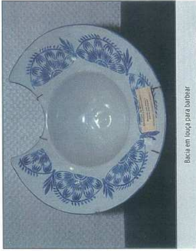
Bacia em louça para barbeiro